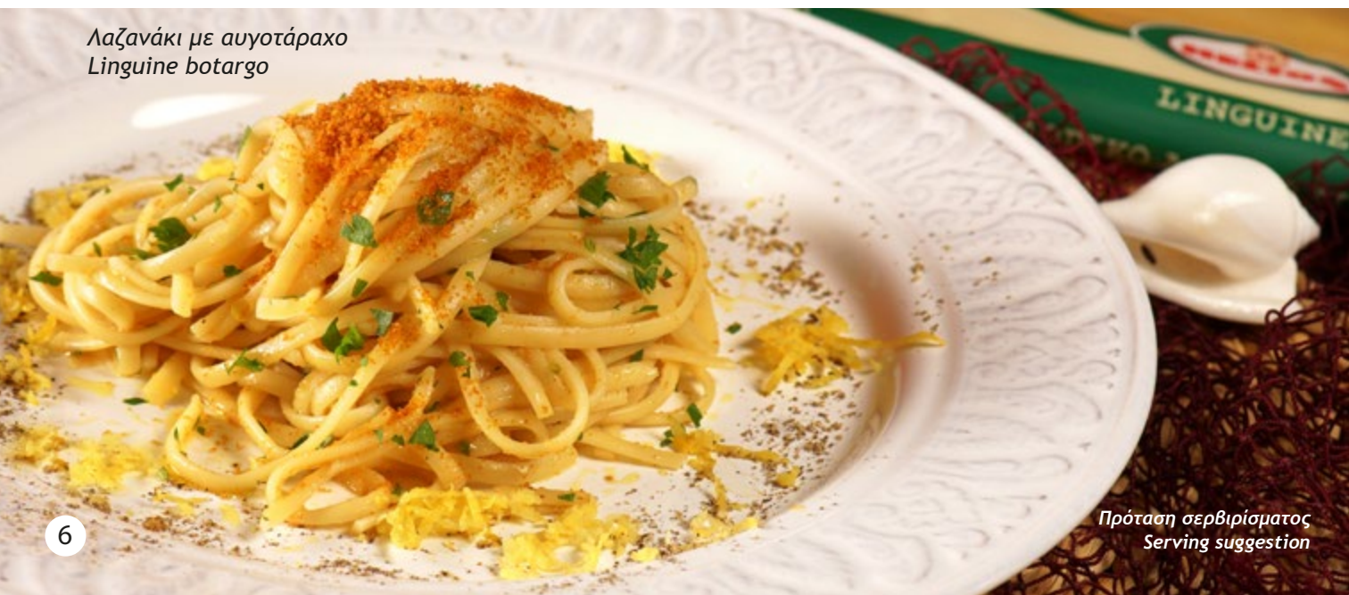
Λαζανάκι με αυγοτάραχο Linguine botargo

The HELIOS organic pasta range received acclaim at the 2023 BIO FOOD AWARDS in recognition of its exceptional quality.