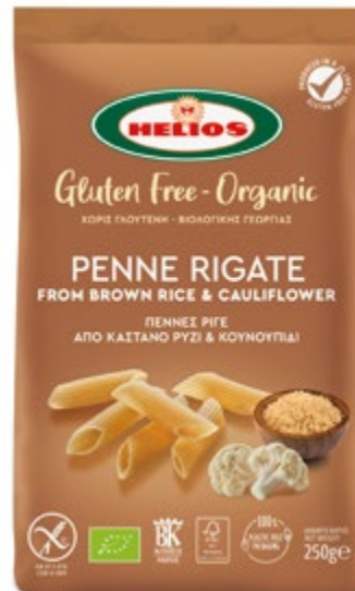
ΠΕΝΝΕΣ ΡΙΓΕ ΑΠΟ ΚΑΣΤΑΝΟ ΡΥΖΙ & ΚΟΥΝΟΥΠΙΔΙ PENNE RIGATE FROM BROWN RICE & CAULIFLOWER

12 x 250g EAN: 5201020910286 ITF: 55201020910281