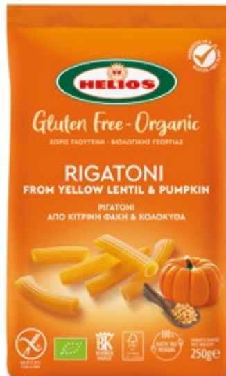
ΡΙΓΑΤΟΝΙ ΑΠΟ ΚΙΤΡΙΝΗ ΦΑΚΗ & ΚΟΛΟΚΥΘΑ RIGATONI FROM YELLOW LENTIL & PUMPKIN

12 x 250g EAN: 5201020910279 ITF: 55201020910274