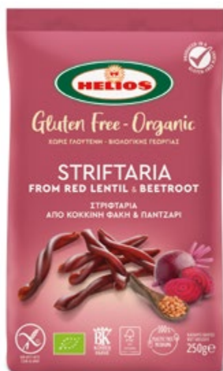
ΣΤΡΙΦΤΑΡΙΑ ΑΠΟ ΚΟΚΚΙΝΗ ΦΑΚΗ & ΠΑΝΤΖΑΡΙ STRIFTARIA FROM RED LENTIL & BEETROOT

12 x 250g EAN: 5201020910279 ITF: 55201020910274